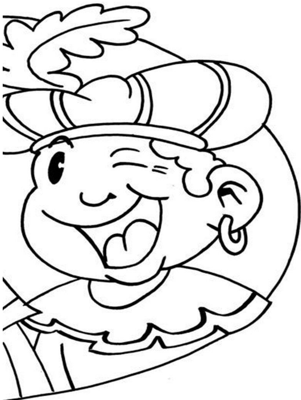
" Landgoed Wolfslaar [Typ hier]